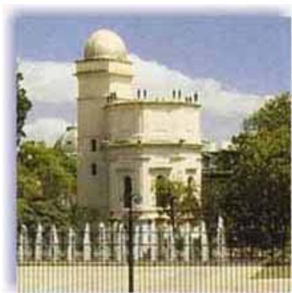
El Observatorio Astronómico de Bogotá, el más antiguo de América