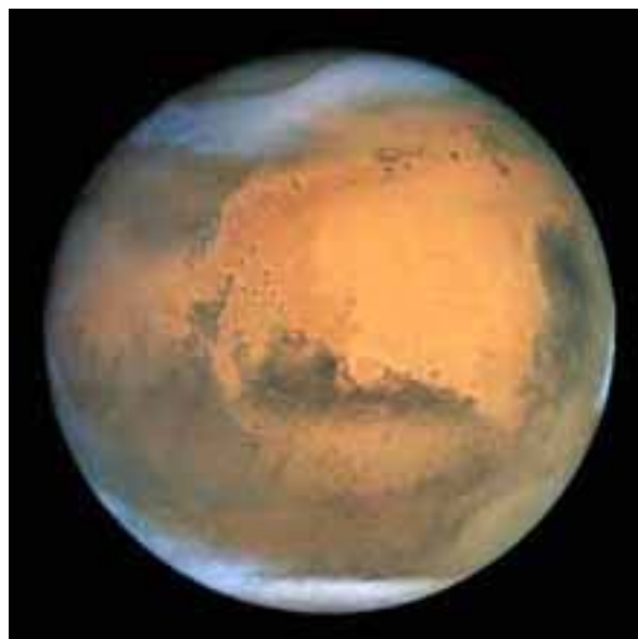
Christian Huygens descubrió los casquetes polares del planeta Marte